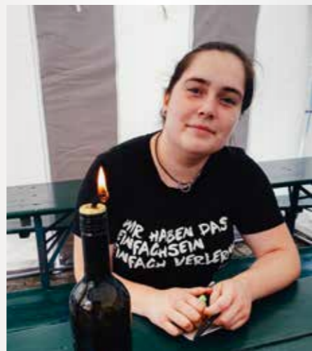
Aus alten Glasflaschen wurden Fackeln für die nächste Gartenparty.