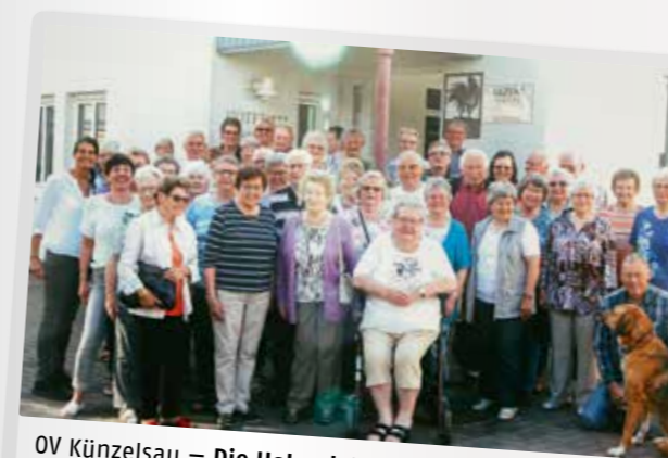
OV Künzelsau – Die Hohenloher unterwegs Die Senioren der AWO Künzelsau grüßen von ihrer Freizeitwoche aus Bad Neustadt-Saale. Ausflüge nach Bad Kissingen, Schmalkalden, Zella-Mehlis, Oberhof und eine Rhönrundfahrt rundeten die tolle Woche ab.