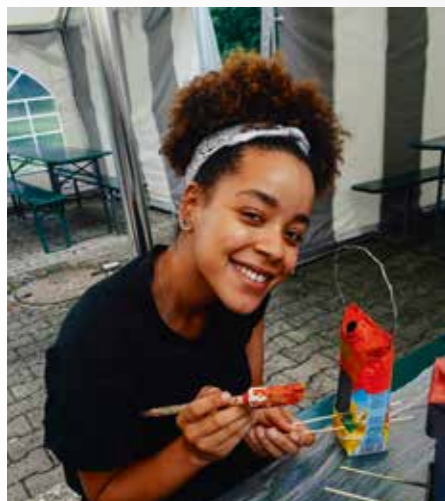
Aus Tetrapacks wurden Vogelhäuschen

Seit dem Vertiefungsseminar sammelte die komplette Seminargruppe Plastikdeckel, um das Projekt „Deckel gegen Polio“ des Vereins „Deckel drauf“ zu unterstützen. Pro 500 Deckel, die gesammelt werden, kann eine Impfung gegen Polio finanziert werden. Zusammen sammelten die FSJler in nur drei Monaten über 19.000 Deckel. Sie können damit 38 Kindern ein Leben ohne Kinderlähmung ermöglichen. •