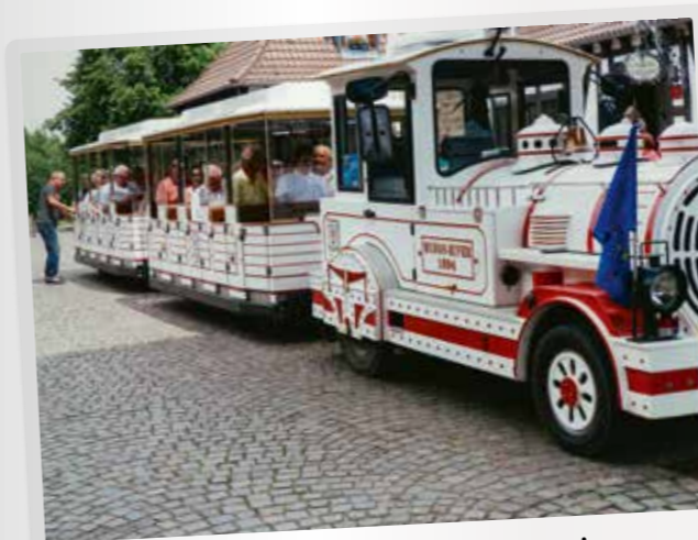
OV Bad Friedrichshall – Von Pflanzen zum Wein Auf der Heimfahrt wurde gesungen. Kein Wunder, 53 Reiselustige von der AWO Bad Friedrichshall sowie den VdKen Gundelsheim/Offenau und Bad Wimpfen hatten den Tag über nicht nur das Kakteenland Steinfeld und seine tropische Pflanzen besucht. Auch das Weintor in Schweigen, das elsässische Wissembourg samt Waschhaus, Salzhaus und Abteikirche Saints-Pierre-et-Paul standen auf dem Programm, das in Gleiszellen in einer Weinstube mündete.