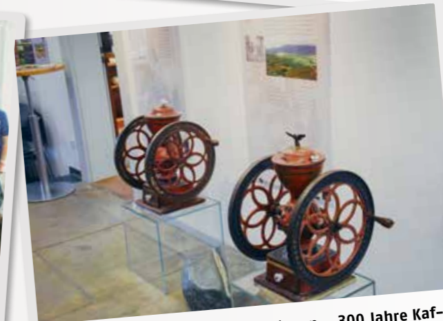
Ausflugstipp | Ortsverein Münchingen – 300 Jahre Kaffeemühlen, AWO Korntal-Münchingen on Tour 44 gut gelaunte AWO-Mitglieder bestaunten im Kaffee-Mühlen-Museum in Wiernsheim über 1000 Exponate aus drei Jahrhunderten. Ob Propeller-, Scheiben-, Flach-, Kegel- oder Walzenmühlen, zu jeder konnte die Museumsführerin eine Geschichte erzählen. Danach ging's ins Museumscafé und nach Gebersheim zum Abendessen. www.kaffeemuehlenmuseum.de