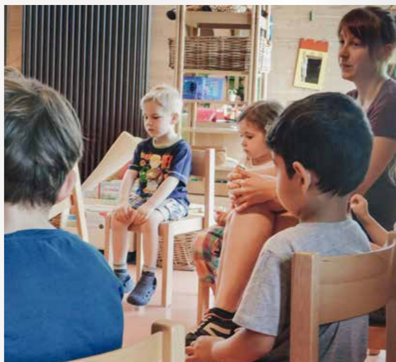
Bei der Kinderkonferenz in der KiTa wird alles angesprochen, was die Kinder betrifft oder bewegt.